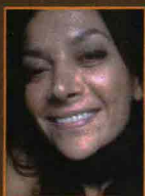
di Francesca Marotta